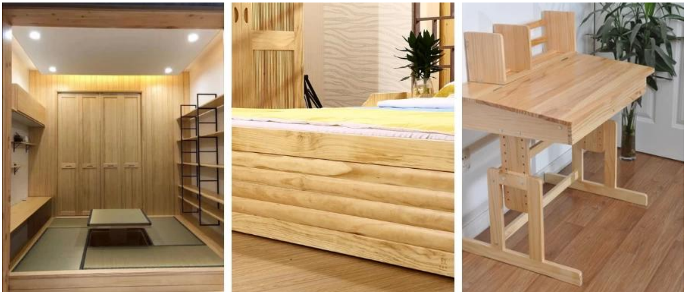
(Кина Радиата Пине Слатс Фабрика)

Индустрија паковања: Због релативно ниске цене, једноставне обраде и одређене чврстоће, често се користи за прављење свих врста кутија за паковање, ладнице и друге логистике и материјале за транспорт паковања.